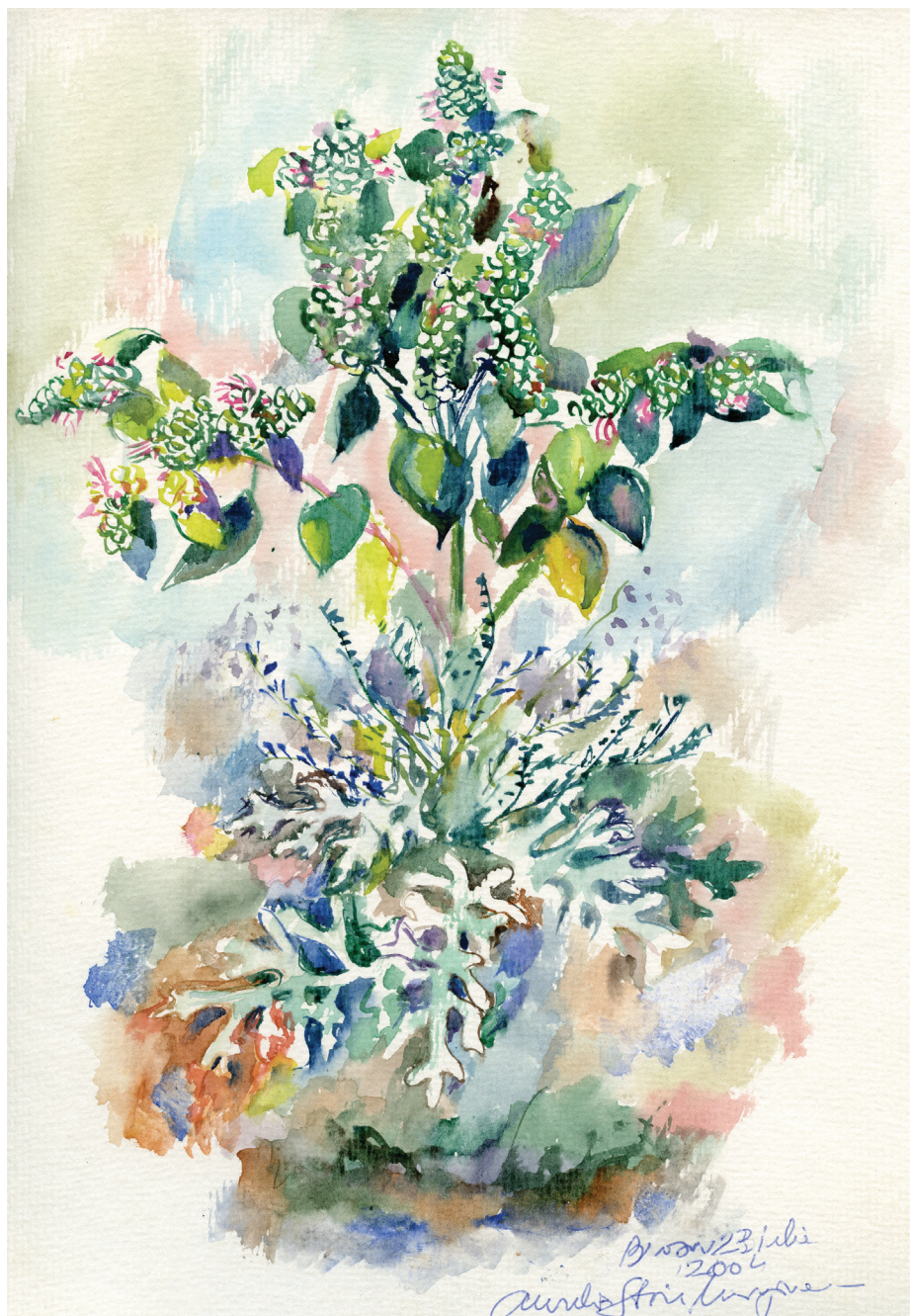
01. Busiuc și alte frunze